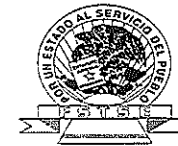
TABLA DE ACTUALIZACIÓN Y CONSERVACIÓN DE LA INFORMACIÓN PÚBLICA DE LAS OBLIGACIONES COMUNES Y ESPECÍFICAS DE TRANSPARENCIA, DEL SEGUNDO TRIMESTRE DEL 2025 DE LA LEY FEDERAL DE TRANSPARENCIA Y ACCESO A LA INFORMACION PUBLICA EN LA PLATAFORMA NACIONAL DE TRANSPARENCIA.